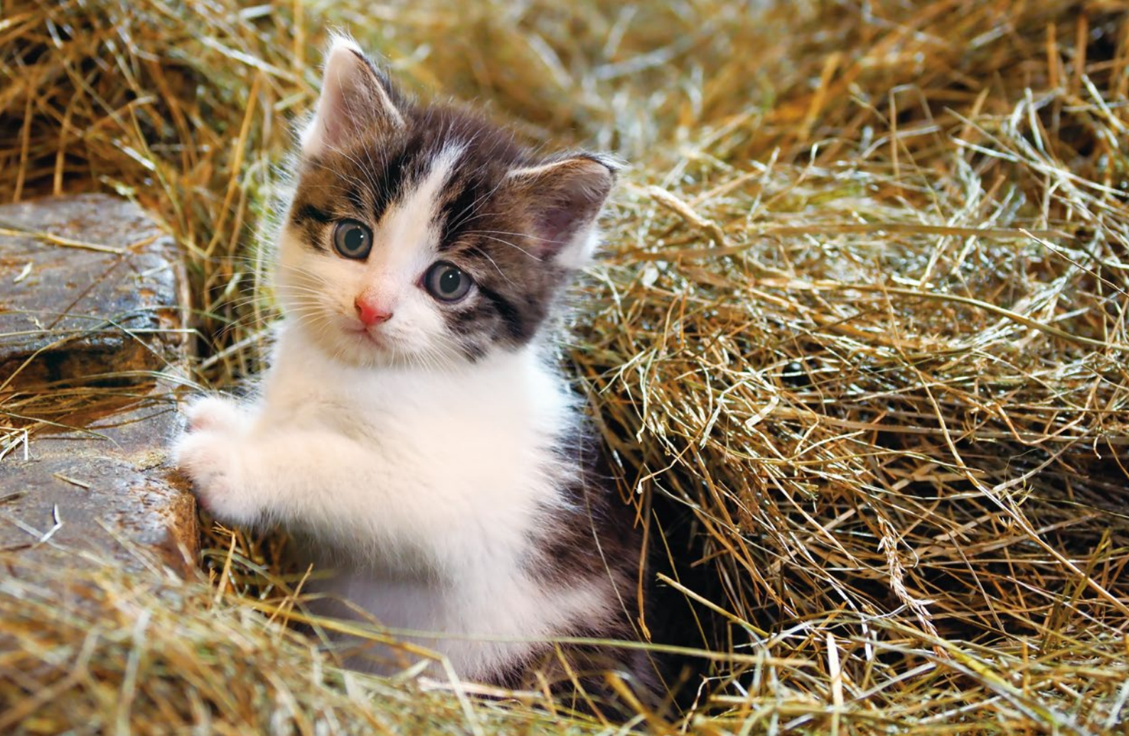
アイスランド、レイクホルト