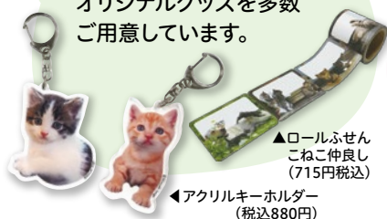
▲ロールふせん こねこ仲良し (715円税込)