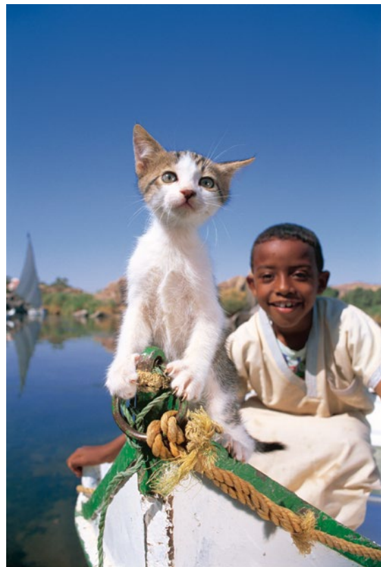
エジプト、エレファンティネ島